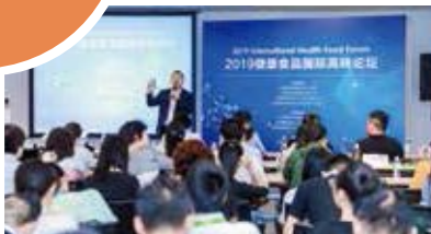
健康食品国际高峰论坛