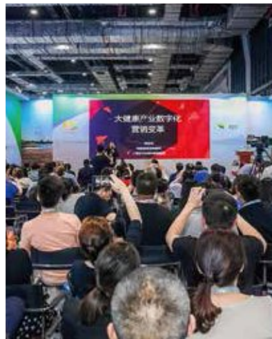
“创新汇”新新营销与 创新研发研讨会