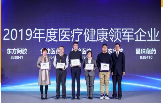
2019年度医疗健康领军企业十大产品奖