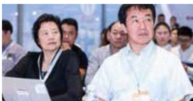
特殊膳食营养与健康高峰论坛 暨老年营养与健康专题论坛