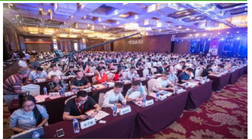
2021健康产业十大领军企业奖