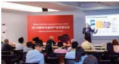
营养与食养产业发展论坛