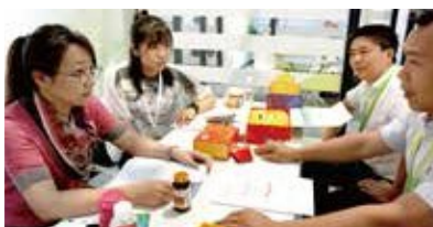
连锁商超、连锁药店配对会