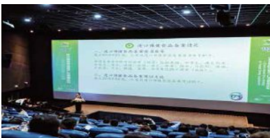
大健康产业发展高峰论坛