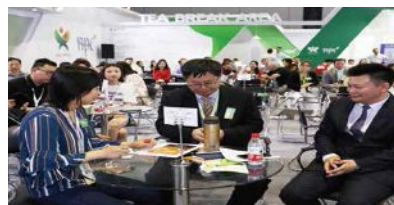
自贸区进出口食品采购对接会