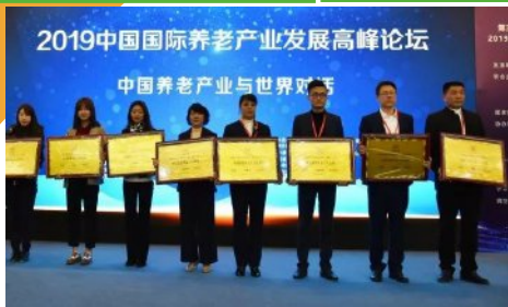
2021健康养老产业十大企业奖