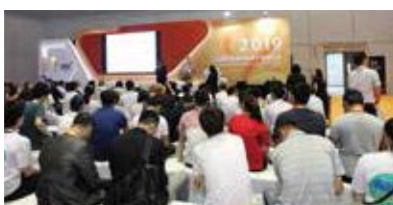
健康产品新技术新产品发布会 品牌推介会