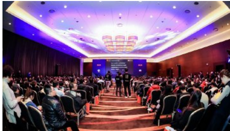
2021特殊食品十大产品奖