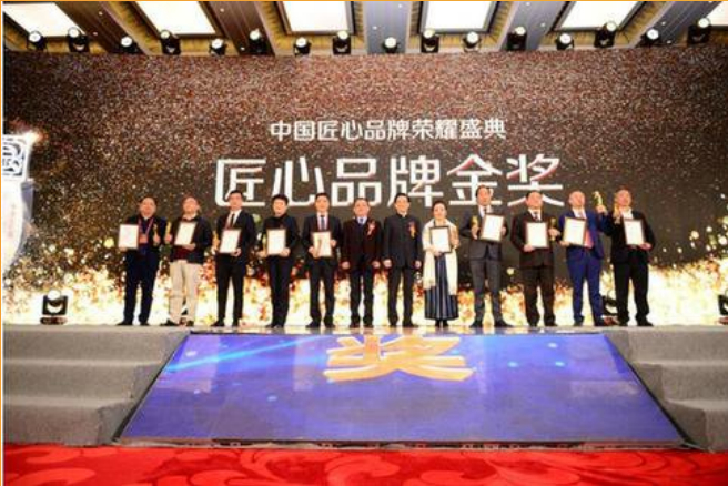
2021健康养生行业十大匠心人物奖