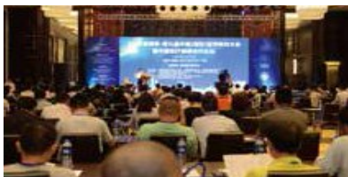
一带一路健康原料产业大会