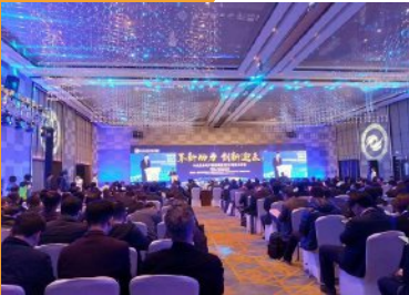
2021健康养生教育培训十大领军人物奖