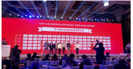
2021健康养生电商平台十大杰出人物奖