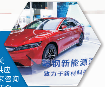
鞍钢新能源 致力于新材料

德特克公司致力于3D数字技术领域研发、整合和服务，产品广泛用于汽车制造领域；本次参加 AUTO TECH 2021 主要展出手持式3D激光扫描系统Dreidtek系列产品，效果很好，得到了许多行业客户的认可。华南地区是中国的汽车六大汽车制造基地之一，市场地位很重要。通过 AUTO TECH 汽车制造技术及装备展，我们收获了许多新客户，来年我们还会来参加。