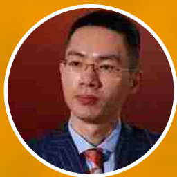
吴荣照 鸿星尔克董事长