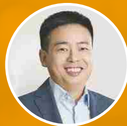
叶国富 名创优品创始人