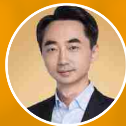
刘润 知名财经作家