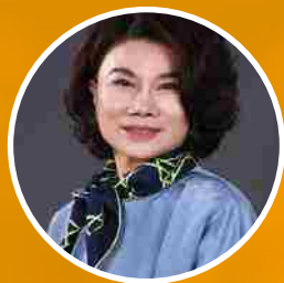
董明珠 格力集团董事长