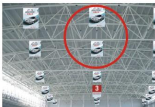
展馆内吊旗 规格：3M（宽）×5M（高） 价格：5000元（单面）、10000元（双面）