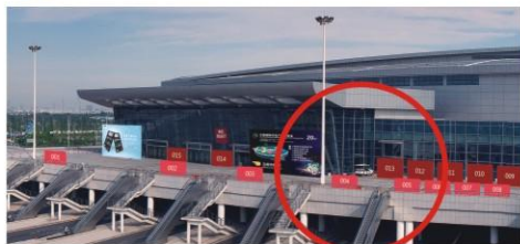
桁架广告 规格：5M（宽）×3M（高） 价格：10000元（单面）、15000元（双面）