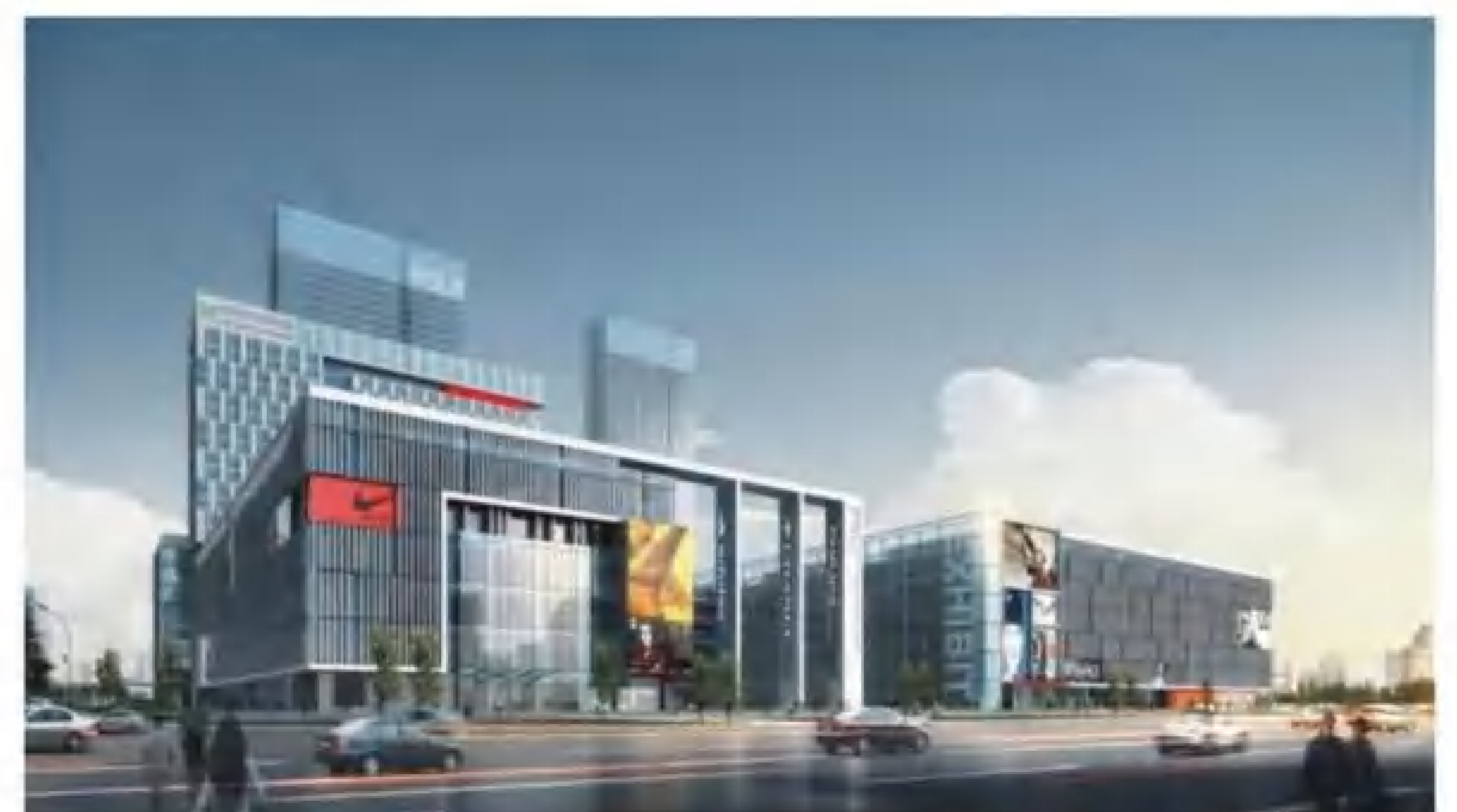
广州·保利世贸博览馆

保利世贸博览馆是保利会展旗下的标志性品牌项目，集展览、会议、餐饮和住宿等多种功能于一体，是华南地区重要的综合性会展中心之一。自2008年正式投入使用以来，保利世贸博览馆租馆率常年保持中国贸促会权威会展统计数据中全国前五名，近七年持续位居广州首位，是国内极少数同时获得国际展览联盟（UFI）、国际展览与项目协会（IAEE）、国际大会及会议协会（ICCA）和国际会议中心协会（AIPC）四家国际权威行业组织认证会员资格的场馆，深受业界瞩目。