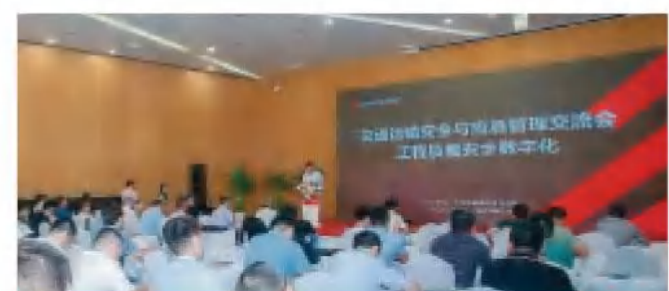
数字化安全与应急