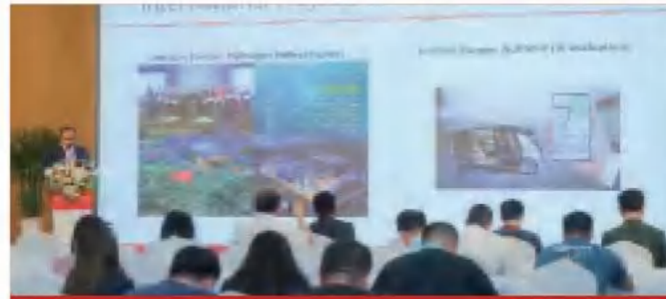
国际化智能领域发展