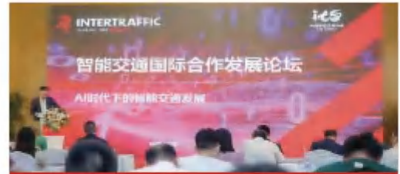
出海企业合作交流