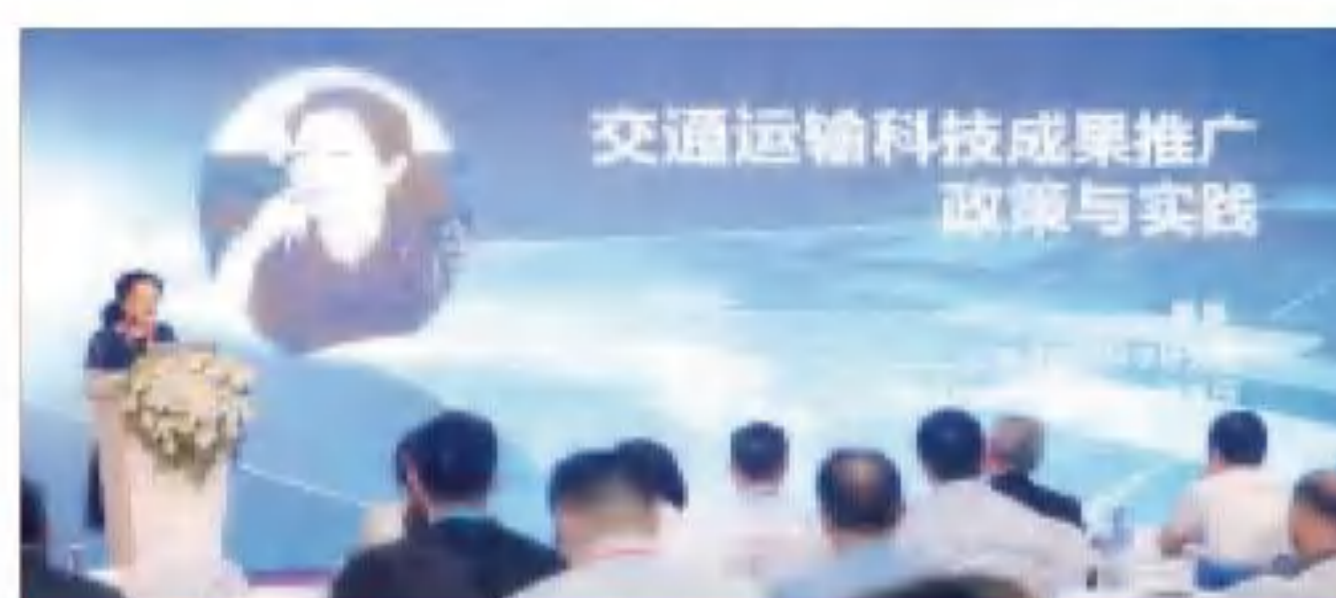
交通运输科技成果发布