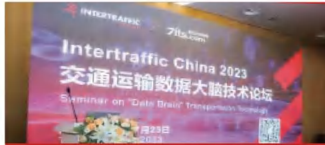
交通运输“数据大脑”技术研讨

2024展会将聚焦交通运输“数据大脑”、智慧出行、基础设施数字化发展、交通运输信创发展、充电及停车等领域，更有企业主题路演、双语国际合作论坛、出海企业交流、优秀产品推选、行业最新科技成果发布等主题活动，成就展区进行数字成果展示，并透视行业发展的全景视角，缔造无限精彩！