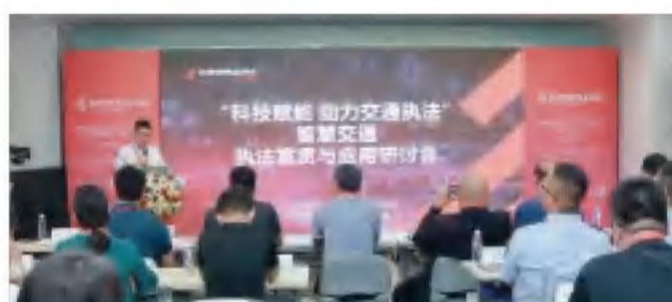
科技赋能智慧交通执法