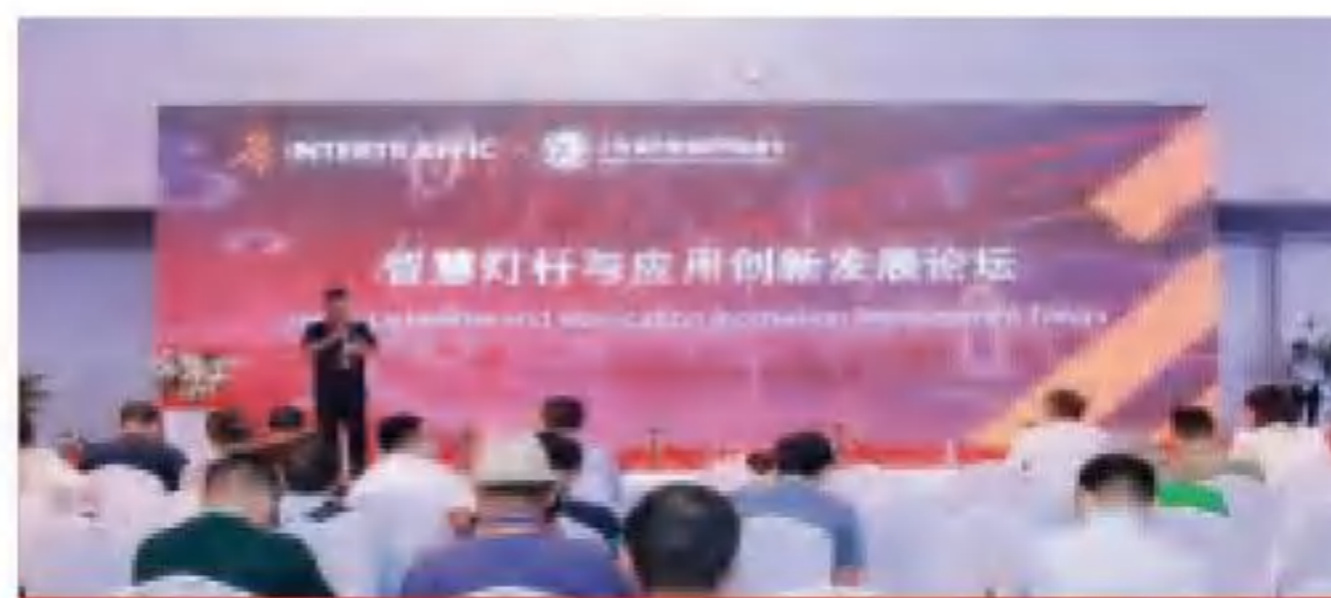
智慧灯杆应用及发展