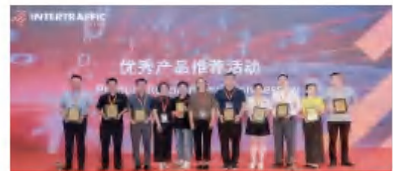
优秀产品推选及需求发布